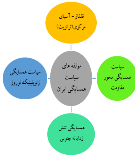
شکل 5-1. مولفه‌های سیاست همسایگی فرکتالی ایران