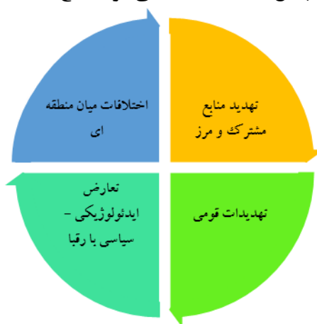
شکل 4-1. چالش‌های محیط همسایگی ایران

4- اختلافات میان منطقه‌ای بازیگران در محیط همسایگی و چند همسایگی ایران: تنش‌های میان ارمنستان و آذربایجان، ترکیه با ارمنستان، عراق با ترکیه، مسئله کردها، اختلافات پاکستان و افغانستان از جمله بستر-های تنش ساز منطقه‌ای است که منافع ایران را تحت تأثیر قرار داده است.