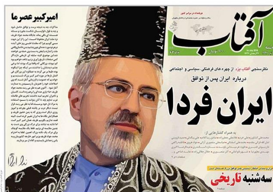
شکل (۳): کاربرد قیاس امیر کبیر