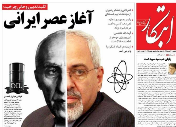
شکل (۲): کاربرد قیاس ملی‌سازی نفت