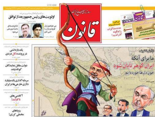
شکل (۴): کاربرد قیاس آرش کمانگیر

هر دو رویداد، دفاع از کیان ایران و منافع ملی). قیاسگر، همچنین با چاپ یک تصویر، چهره محمدجواد ظریف را با چهره شخصیت آرش کمانگیر ترکیب کرده و دیپلمات‌های ایرانی دیگر حاضر در مذاکرات هسته‌ای، یعنی علی‌اکبر صالحی، عباس عراقچی، و مجید تخت‌روانچی را در کنار ظریف به تصویر کشیده است و در متن از آن‌ها با عنوان «کمان‌داران ایرانی» یاد می‌کند؛ بنابراین، استدلال قیاسی قیاسگر بر قیاس «ظریف» با «آرش کمانگیر» بنا شده و بر این اساس، موافقت خود را با توافق هسته‌ای برجام اعلام می‌کند. همان‌گونه که داده‌های موجود در نمودار شماره (۱) نشان می‌دهد، نقطه اوج به کارگیری قیاس‌های تاریخی در رویارویی با رویداد جاری، توافق ژنو ۱۳۹۲ بوده است. پس از توافق هسته‌ای ژنو، روند به کارگیری قیاس‌ها، سیر نزولی به خود می‌گیرد؛ به گونه‌ای که در نقطه زمانی سال ۱۳۹۳، میزان استفاده از قیاس‌های تاریخی به چهار مورد کاهش می‌یابد. این روند، به گونه‌ای ثابت تا نقطه زمانی توافق هسته‌ای لوزان در فروردین ۱۳۹۴ ادامه می‌یابد، تا اینکه توافق نهایی برجام در تیر ۱۳۹۴ به دست می‌آید. در این نقطه زمانی، دوباره روند به کارگیری قیاس‌های تاریخی با فراوانی ۹ مورد، سیر صعودی به خود می‌گیرد و در ادامه نیز این روند متوقف نشده و همچنان، تا پایان بازه زمانی مورد بررسی، ادامه دارد. برپایه داده‌های موجود، نقطه اوج به کارگیری قیاس‌های تاریخی، توافق ژنو ۱۳۹۲ بوده است. پس از این توافق، روند زمانی به کارگیری قیاس‌ها سیر نزولی داشته است، به گونه‌ای که در نقطه زمانی سال ۱۳۹۳، میزان استفاده از قیاس‌های تاریخی به چهار مورد کاهش می‌یابد. این روند به گونه‌ای ثابت، تا نقطه زمانی توافق هسته‌ای لوزان در فروردین ۱۳۹۴ ادامه می‌یابد.