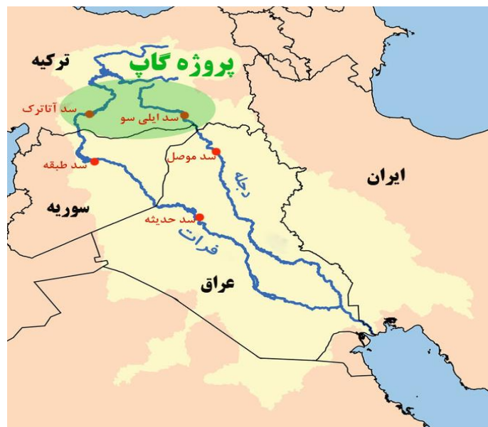
نقشه (۱): نقشه اجرای پروژه گاپ http://ardabilli.blogfa.com