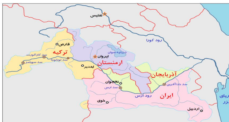
نقشه (۳): نقشه حوضه آبریز ارس و سدهای ساخته شده بر روی رودخانه ارس

ایران و جمهوری آذربایجان که آب ارس به سمت خاک این دو کشور جریان می‌یابد، پایین دست هیدروپلیتیکی محسوب می‌شوند (Kalantari & Hikmatara, 2020, 3-10). پروژه داپ کاملاً به صورت محرمانه و بدون انتشار اطلاعات پیش می‌رود تا جو بین‌المللی شکل گرفته علیه ترکیه در پروژه گاپ، برای پروژه داپ تکرار نشود. بر اساس اطلاعات موجود، پروژه داپ ۹۰ سد و ۱۰۰ طرح آبیاری اراضی کشاورزی را در خود جای داده است و این طرح‌ها بر روی حوضه آبریز ارس در حال اجرا است. ایده راه اندازی آن، متأثر از تجارب کسب شده از پروژه گاپ می‌باشد (Mianabadi, 2022, 1). در بخش ترکیه‌ای حوضه آبریز رودخانه ارس، ۱۴ سد و یا نیروگاه برق آبی وجود دارد که از این تعداد، ۵ سد و نیروگاه برق آبی با ظرفیت ۱۳۴ مگاوات در سال در حال بهره‌برداری است و ۹ سد و نیروگاه برق آبی هم در دست ساخت و یا برنامه‌ریزی هستند که با بهره‌برداری از آنها، مجموع ظرفیت این سدها و نیروگاه‌های برق آبی به ۳۸۷ مگاوات در سال خواهد رسید (Enerji Atlası, 2016, 12). سد کاراکورت به‌عنوان بزرگ‌ترین و مهم‌ترین سد ترکیه در این حوضه، در سال ۲۰۲۰ مورد بهره‌برداری قرار گرفته است که مجموع ظرفیت تولید نیروگاه برق آبی ترکیه در حوزه ارس را به ۲۴۴ مگاوات در سال خواهد رساند (Haberturk, 2020, 8).