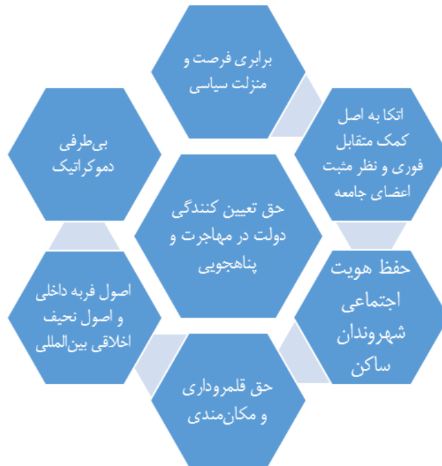
شکل (۳): گراف دیالکتیک دولت‌گرایی و اخلاق‌گرایی بین‌المللی در اندیشه مایکل والزر

باز را که در آن همه افراد نیازمند مدارا با دیگری اند را ایجاد می‌کند. اما الان دو گروه: اعضا و پناهندگان توسط یک قدرت برتر واحد مورد مدارا واقع نمی‌شوند، آنها باید با یکدیگر مدارا کنند و با تلاش خود همزیستی را ایجاد کنند. همچنین این امری دور از ذهن نیست، موفقیت آن به نحوی تنها در حالتی حاصل می‌شود که تقریباً تنها دو گروه برابر وجود داشته باشد و جایی که برابری در طی زمان پایدار باشد و سپس تخصیص متناسب با منابع و مناصب در امور شهری صورت گیرد، بدین ترتیب هیچ گروهی نیازمند ترس از تسلط دیگران نیست (Walzer, 1997, 169). ترسی که در این خصوص شکل می‌گیرد از نیروهای گریز از مرکزی است که گروه و اعضای متعهد خودشان را رهبری می‌کنند تا از سوی دولت حمایت‌های مثبت بیشتری را دریافت کنند، در صورتی که حمایت در اصل تنها می‌تواند به نحو برابر از تمام گروه‌ها صورت گیرد (Walzer, 1997, 172).