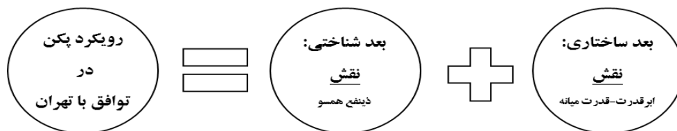
شکل (۱): نمای کلی رویکرد پکن در همکاری راهبردی مشترک با تهران بر اساس نظریه نقش