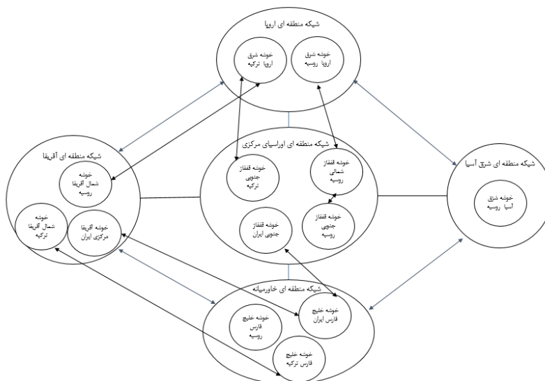
شکل (۱): ترسیم منطقه گرایی شبکه ای روسیه در سیستم شبکه ای بین الملل