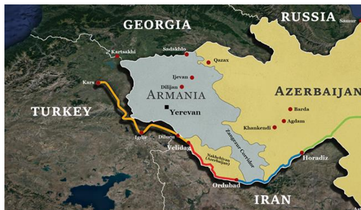
نقشه (۲): مسیر دالان زنگزور

این دالان در منطقه زنگزور و در استان سیونیک ۲ ارمنستان قرار دارد. منطقه زنگزور قطعه بزرگی از زمین مسطح و پرآب در منطقه‌ای خشک و ناهموار است. جایی که کوه‌های قفقاز کوچک، ارتفاعات آناتولی و رشته‌کوه‌های زاگرس به هم می‌رسند. حاصلخیز بودن منطقه زنگزور آن را به خودی خود به یک دارایی ارزشمند تبدیل می‌کند، اما ارزش واقعی این دالان به دلیل نقش مهم آن به عنوان دالان حمل و نقل است. دالان نخجوان (دالان زنگزور در قدیم به این نام شناخته می‌شد) با دو خط آهن نیز در زمان اتحاد جماهیر شوروی برای اتصال نخجوان به قلمرو اصلی ساخته شده بود، اما این خطوط آهن در طول جنگ اول قره‌باغ که در سال ۱۹۹۲ آغاز شد غیرقابل استفاده شد. این زمین کوچک و به ظاهر فراموش شده، از مدتها قبل از حضور ترک‌ها و روس‌ها، محل تلاقی رقابت‌های منطقه‌ای بوده است. پس از انقلاب ۱۹۱۷ در روسیه بین دو حکومت آذربایجان و ارمنستان برای تصرف مناطق میانه دو کشور بخصوص منطقه زنگزور درگیری‌های فراوان وجود داشت. سیر تحولات بین سالهای ۱۹۱۸ تا سال ۱۹۲۱ در منطقه قفقاز و قدرت گرفتن گروه‌های رادیکال ارمنی که سبب ساز کشتار تعداد بسیاری از مسلمانان ترک در این منطقه شد، عامل