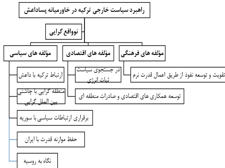
شکل 1. چارچوب مفهومی پژوهش