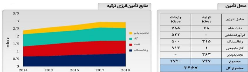
شکل 2. منابع تأمین انرژی ترکیه

واردات انرژی در آینده بلندمدت است و در همین راستا، راهبرد سیاست خارجی خود را هم‌سوی با راهبرد تأمین انرژی تدوین کرده است.