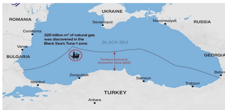
تصویر 4. مکان اکتشاف میدان نفت و گاز جدید ترکیه

حمایت از قبرس به‌عنوان یکی از اعضای اتحادیه اروپا، از ترکیه خواست که به حقوق مستقل کشورهای عضو اتحادیه اروپا احترام بگذارد (Aqayari, 2019). به نظر می‌رسد، اختلاف‌های ترکیه و اتحادیه اروپا بر سر مسئله اکتشافات انرژی این کشور به‌راحتی حل‌شدنی نباشد. ادامه این تنش‌ها باعث شده است که سران اتحادیه اروپا بر سر اعمال تحریم‌های اقتصادی ترکیه با هم توافق کنند و این خبر بدی برای ترکیه است. به‌همین دلیل، اردوغان در تماس با شارل میشل، رئیس شورای اروپایی، خواستار بازگشایی صفحه جدیدی در روابط ترکیه و اتحادیه اروپا شد (Irna, 11/01/2021). اتحادیه اروپا، فعالیت‌های ترکیه در شرق مدیترانه را به‌دیده رفتارهای نامناسب و اقدامات یک‌جانبه می‌نگرد و انتظار دارد، ترکیه به‌عنوان شریک مهم این اتحادیه — که برای پیوستن به آن تلاش می‌کند — این نگرانی‌ها را درک کرده و از افزایش آن خودداری کند. البته ترکیه در میدان گسترده و حساس هیدروکربنی شرق مدیترانه، تنها با بخش روم‌نشین قبرس، یونان، و اتحادیه اروپا طرف نیست، بلکه شیطنت‌های برخی از کنسرسیوم‌های بزرگ وابسته به رژیم صهیونیستی و شرکت‌های آمریکایی نیز منافع بلندمدت ترکیه را در این منطقه تهدید می‌کند و جالب اینجاست که مصر نیز، از دور دستی بر این آتش دارد و از آنجاکه اردوغان به‌دلیل ماجرای کودتا، اخوان‌المسلمین، و مرگ محمد مرسی و همچنین، اعدام بسیاری از فعالان وابسته به جریان اخوان‌المسلمین، از ژنرال سیسی ناخشنود است، در پی این است که به مصر و دیگران فرصت عرض اندام ندهد (Tasnim, 09/08/219).